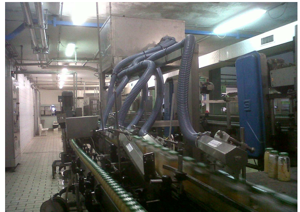
Asciugatura bottigliette succo di frutta Fruit juices bottles drying