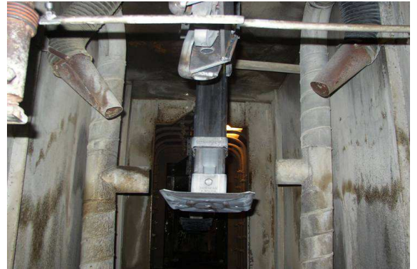
Pulizia pezzi prima della verniciatura Cleaning operation before painting