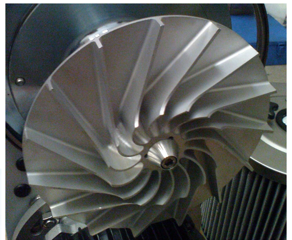
Girante in alluminio lavorata CNC Aluminum impeller CNC machined