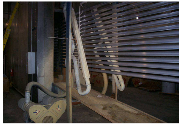
Asciugatura tubi durante la lavorazione Pipes drying during process