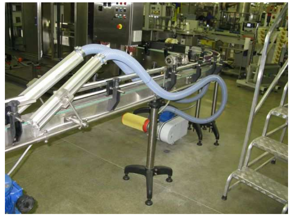
Sistema Republic installato su linea trasporto Republic drying system installed in a conveyor line