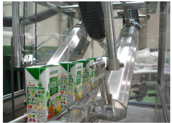
Asciugatura confezioni tetra pak Tetra pak drying

Several models are available, 7 sizes with 3 HP – 75 HP engines. Compact dimensions for an easy placement.