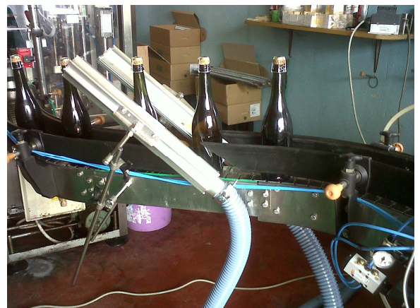
Asciugatura bottiglie vino Wine glass bottles drying