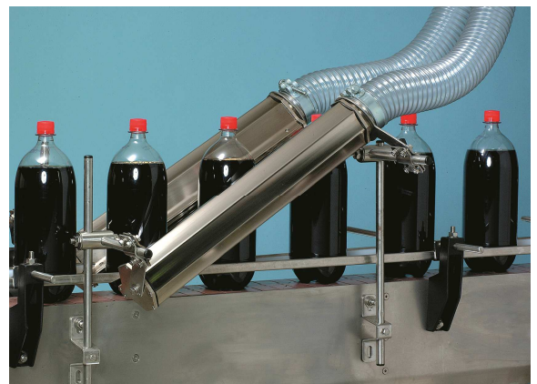
Asciugatura bottiglie PET PET bottles drying