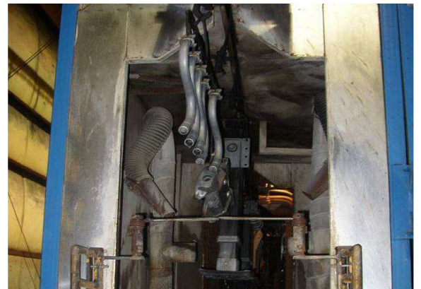
Raffreddamento pezzi appesi Cooling hanging pieces