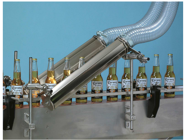
Asciugatura bottiglie in vetro Glass bottles drying

In Italy, the cost of 1 kW/hour is about 0,15 € which, multiplied by the saved energy, means 1.452 € of saved electrical energy!