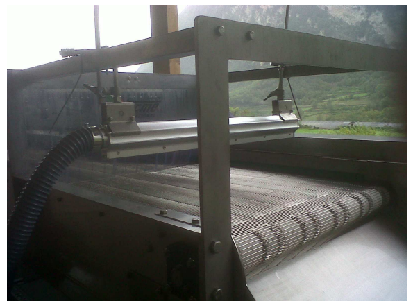
Tappeto in maglia inox per asciugatura frutta Stainless steel mesh conveyor for fruit drying