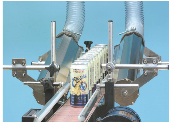
Asciugatura lattine in alluminio Aluminum cans drying