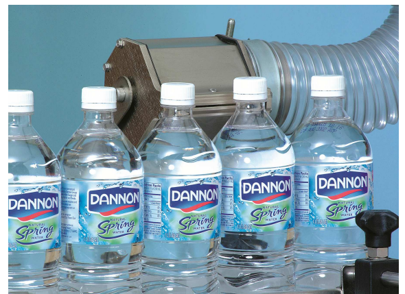
Asciugatura zona tappo Cap area drying