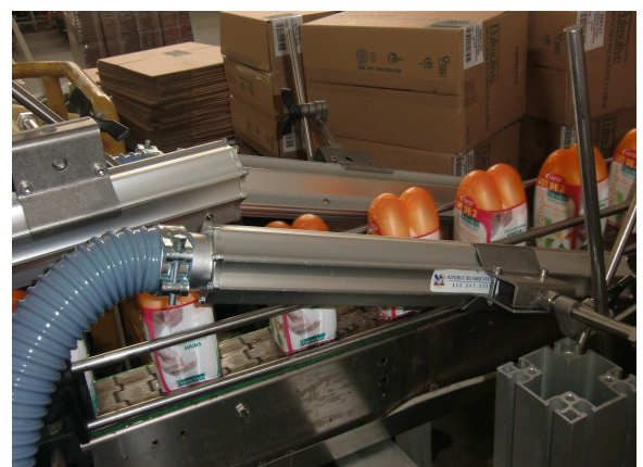
Asciugatura flaconi accoppiati da termoretraibile Plastic bottles drying coupled with thermo retractable film