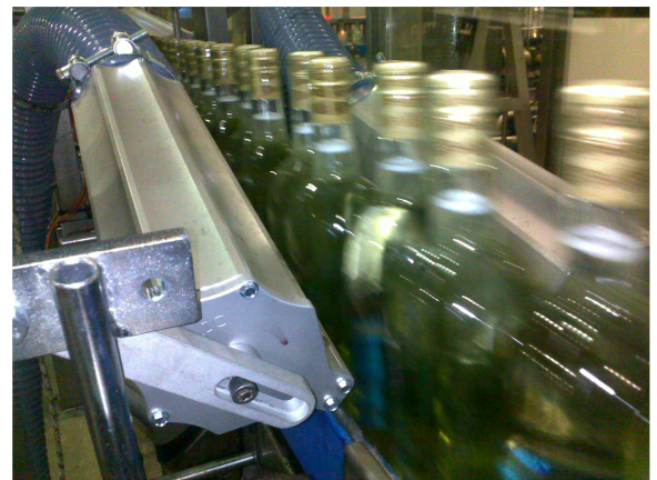
Asciugatura bottiglie di vino Wine glass bottles drying